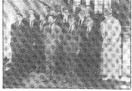
تعديلات حكومية متتالية كان يرأسها دائما جلالة الملك